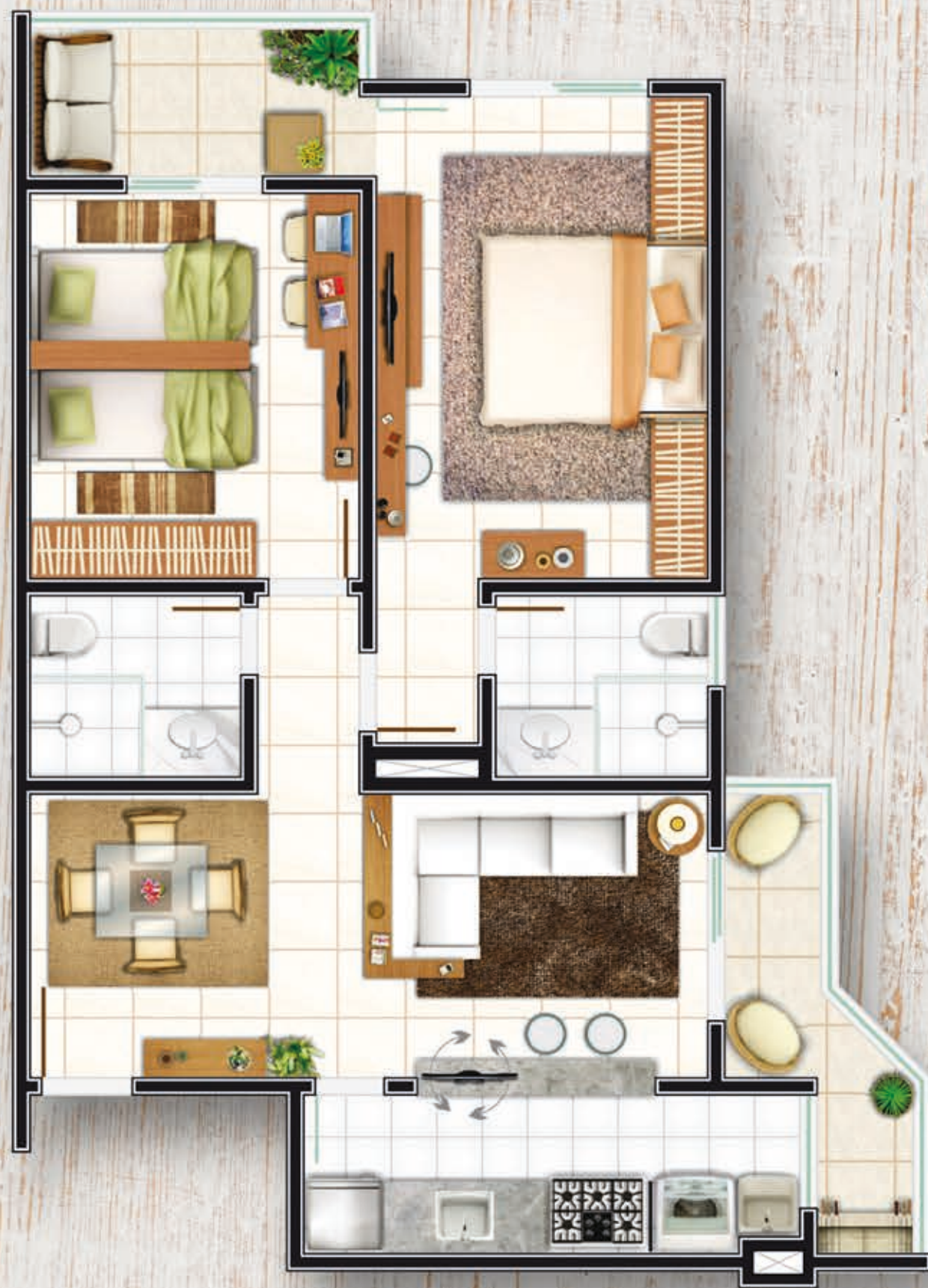
PLANTA HUMANIZADA TIPO