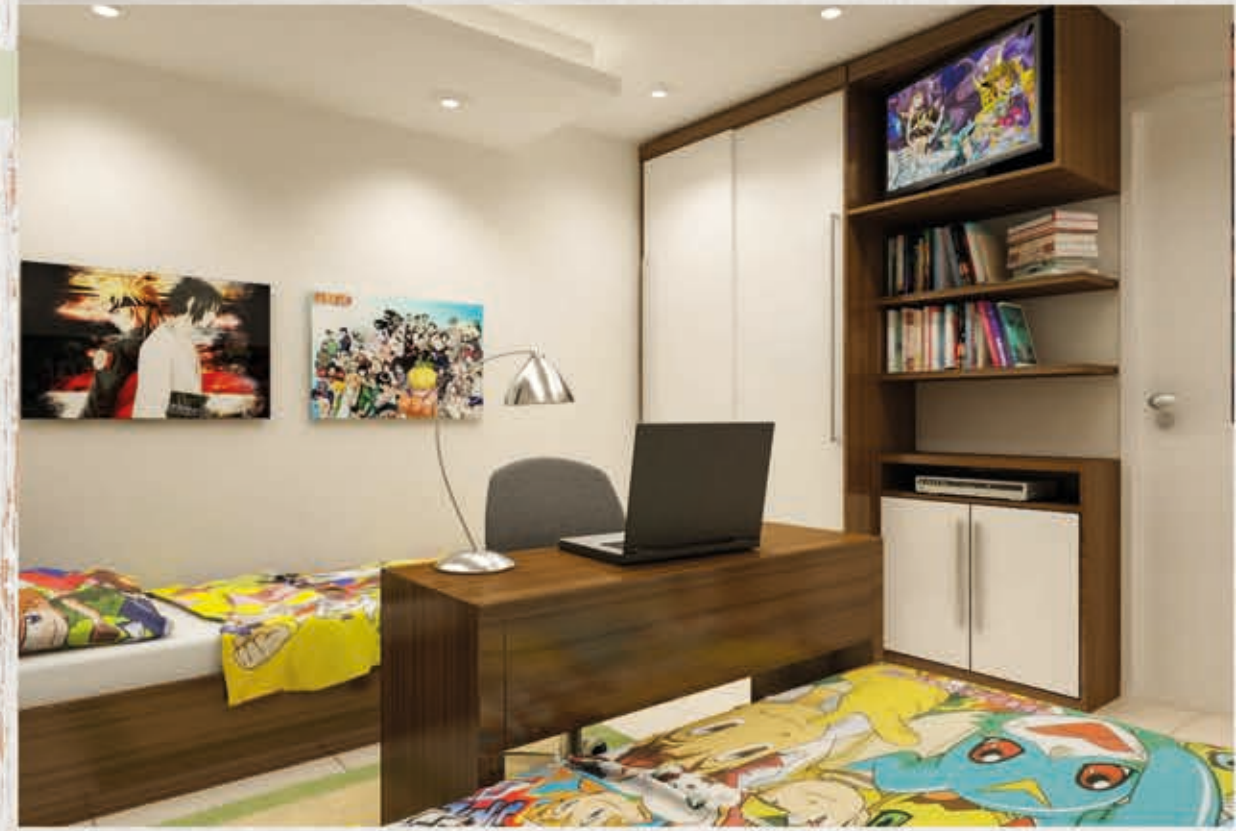
PLANTA HUMANIZADA VARANDA