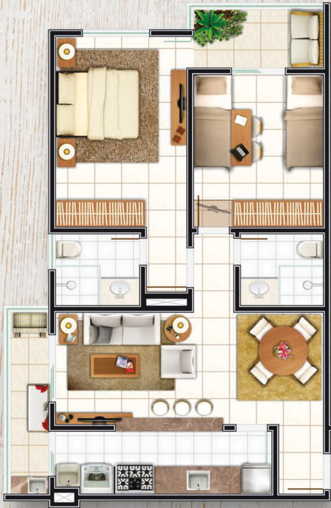
PLANTA HUMANIZADA TIPO